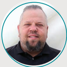
Christian Lacroix Québec