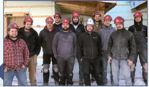
Les travailleurs de la compagnie Habitat Construction, sur un chantier dans la ville de Rimouski.

Au plaisir de vous recroiser dans la région !