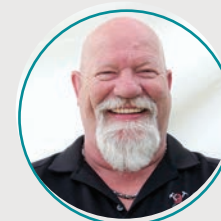
Marcel Duchesne Centre-du-Québec