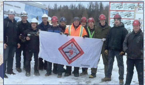
Sur le chantier de l'usine du Marché Blais de Chandler, les travailleurs de la compagnie Les Constructions Pabok ainsi que la compagnie Construction N & R Duguay.