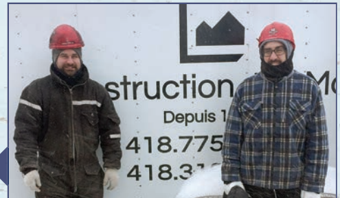
Les travailleurs de la compagnie Construction Joli-Monts.