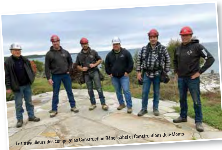
Les travailleurs des compagnies Construction Réno Isabel et Constructions Joli-Monts.

Une chose est certaine, les prochaines négociations seront très intéressantes à suivre, alors on se tient informé et on se tient entre confrères et consœurs parce que c'est ensemble qu'on va finir par améliorer notre sort, notre paie, notre fonds de pension. On le sait : Ensemble, on est la masse!