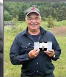
Gilles Roussy Bas St-Laurent / Gaspésie