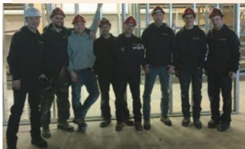
Construction CAP Acoustique / Sidé Acoustique

Ce sera toujours un plaisir et un honneur pour moi de faire respecter vos droits et votre métier.