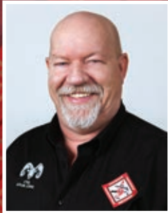
Marcel Duchesne Centre-du-Québec