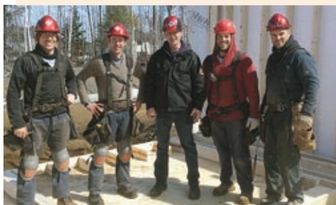
J.G. Provencher Construction