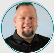
Christian Lacroix Québec