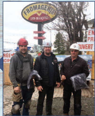
Fromagerie des Basques