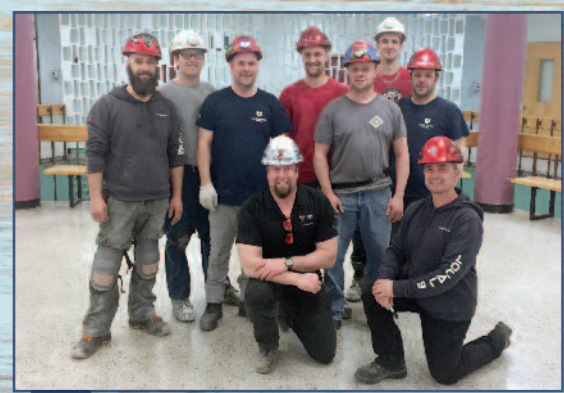
Toujours sur le chantier de réfection de la Promenade de Percé, les travailleurs de la compagnie Construction 4 Saisons.