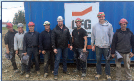
Usine de traitement des eaux Bonaventure