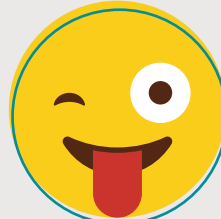
À venir Saint-Jérôme