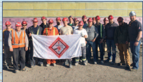
Complexe sportif Desjardins de Rimouski