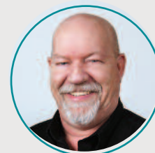
Marcel Duchesne Centre-du-Québec