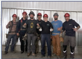
La jeune équipe de la compagnie Hardy Construction sur le projet Kenny U-pull à Rouyn-Noranda