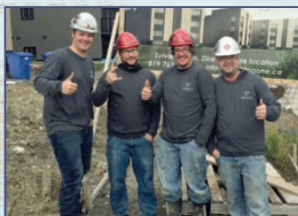
Les travailleurs de la nouvelle compagnie Construction Pentagone de Rouyn-Noranda.