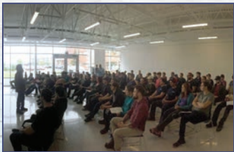
Tournée de la CNESST auprès des nouveaux diplômés en charpenterie-menuiserie du centre Polymétier de Rouyn-Noranda : Parce que ma santé, j'y tiens!