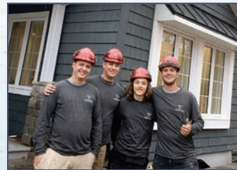
Mes « boys » de construction Boréas à Rouyn-Noranda.