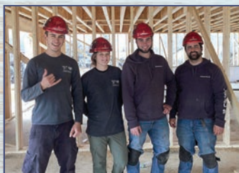
L'équipe de construction Trait Carré en œuvre sur la construction d'un immeuble 4 logis.