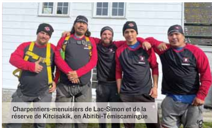
Charpentiers-menuisiers de Lac-Simon et de la réserve de Kitchisakik, en Abitibi-Témiscamingue