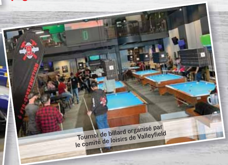
Tournoi de billard organisé par le comité de loisirs de Valleyfield