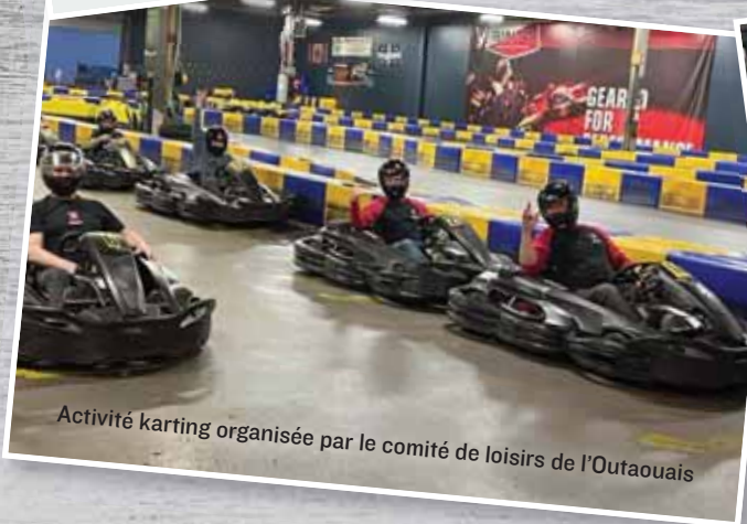
Activité karting organisée par le comité de loisirs de l'Outaouais