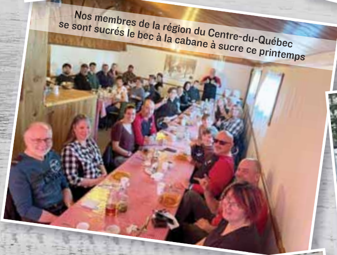
Nos membres de la région du Centre-du-Québec se sont sucrés le bec à la cabane à sucre ce printemps