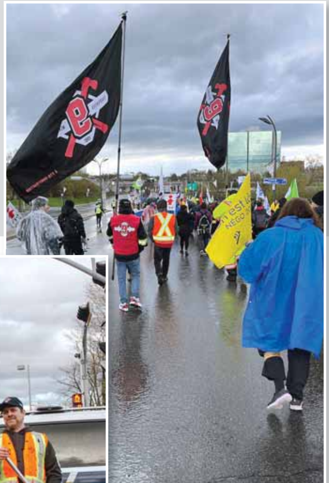
Rassemblement et marche pour souligner la Journée internationale des travailleuses et travailleurs le 1 er mai, à Gatineau

Si vous avez des questions par rapport à l'utilisation des applications de pointage, contactez votre représentant.