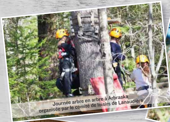
Journée arbre en arbre à Arbraska organisée par le comité de loisirs de Lanaudière