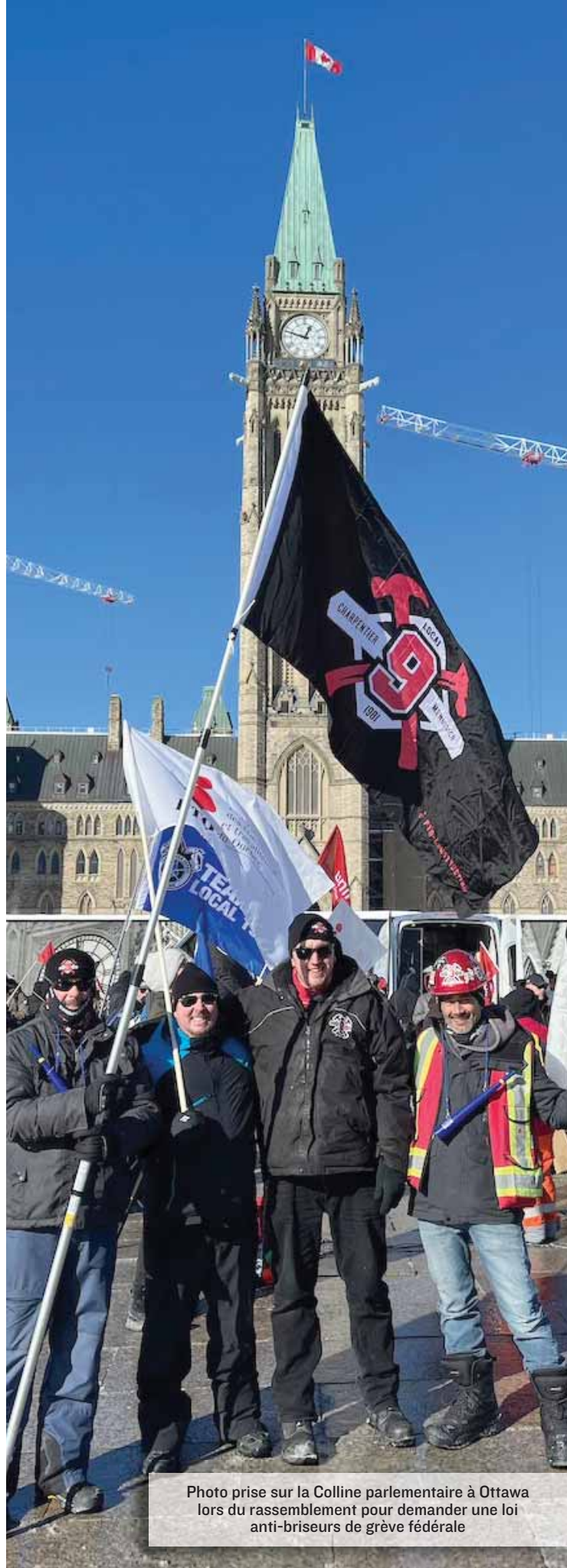
Photo prise sur la Colline parlementaire à Ottawa lors du rassemblement pour demander une loi anti-briseurs de grève fédérale