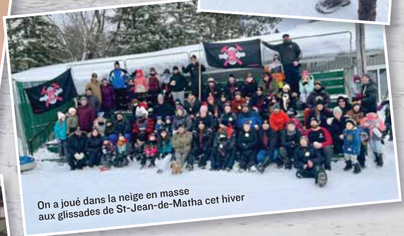
On a joué dans la neige en masse aux glissades de St-Jean-de-Matha cet hiver