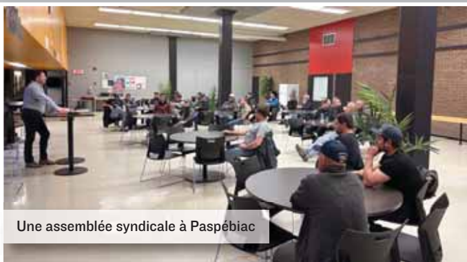
Une assemblée syndicale à Paspébiac

Au plaisir de vous rencontrer bientôt dans une assemblée près de chez vous!