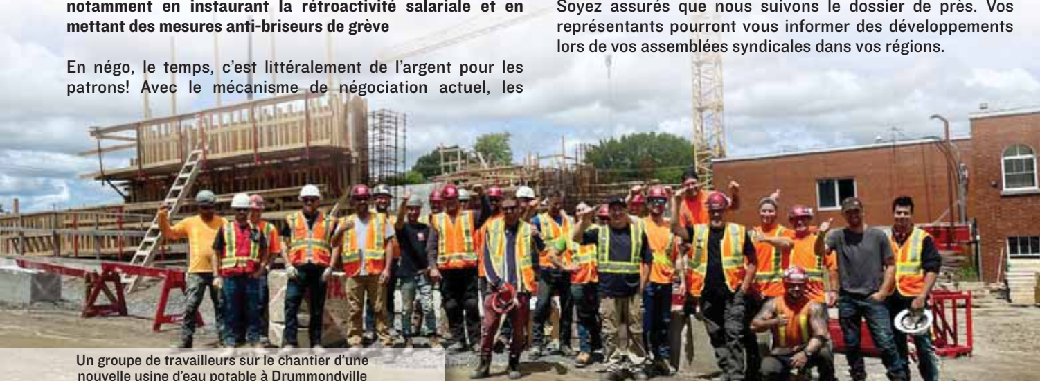
Un groupe de travailleurs sur le chantier d'une nouvelle usine d'eau potable à Drummondville

Soyez assurés que nous suivons le dossier de près. Vos représentants pourront vous informer des développements lors de vos assemblées syndicales dans vos régions.