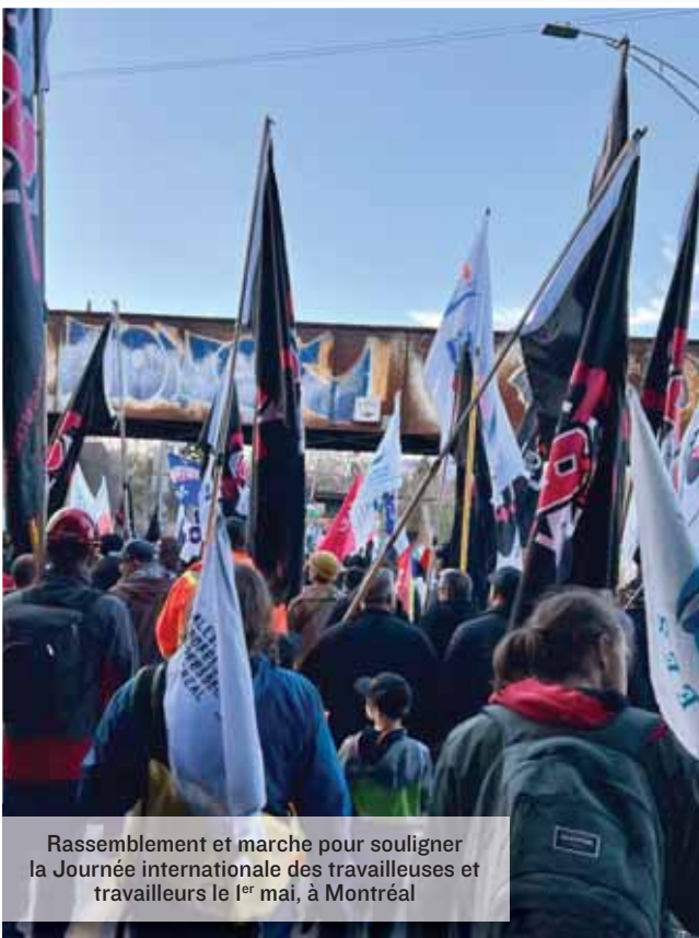
Rassemblement et marche pour souligner la Journée internationale des travailleuses et travailleurs le 1 er mai, à Montréal