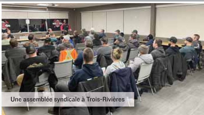
Une assemblée syndicale à Trois-Rivières