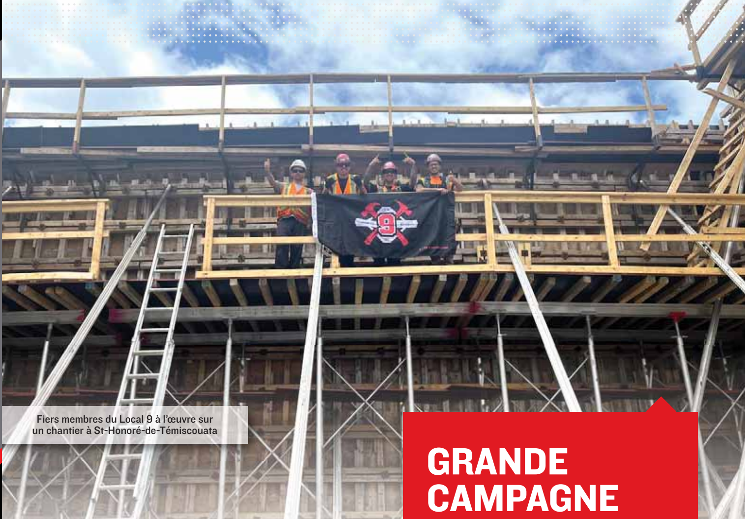
Fiers membres du Local 9 à l'œuvre sur un chantier à St-Honoré-de-Témiscouata