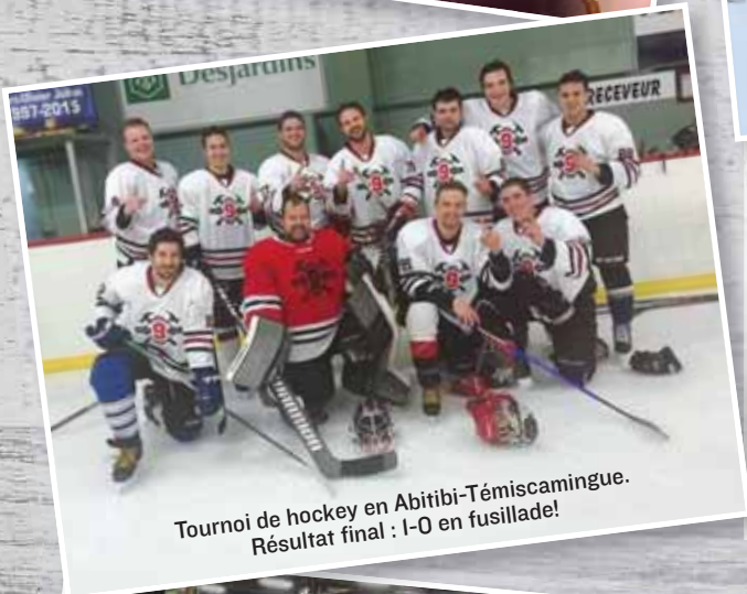
Tournoi de hockey en Abitibi-Témiscamingue. Résultat final : 1-0 en fusillade!

Au Local 9, on s'amuse en masse! Des activités sont organisées par les comités de loisirs partout au Québec. Pour connaître la prochaine activité dans votre région, contactez votre représentant ou consultez la page Quoi de 9 de notre site Web.